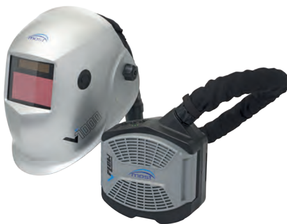
Przyłbica MOST V1000 AIR z MOST V-FLOW / kpl z torbą Nr katalogowy: 72 00 911199