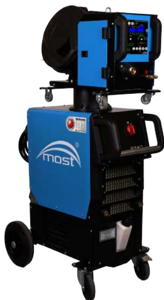
FANMIG 5 PULSE WP