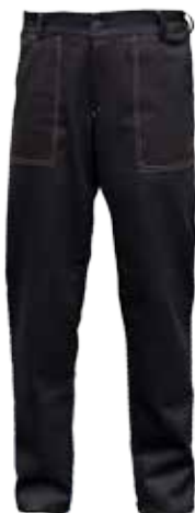
MOST FIBER - ubranie dwuczęściowe Nr katalogowy: 77 09 3000xx