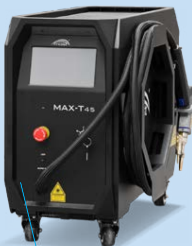
• MOST MAX-T45