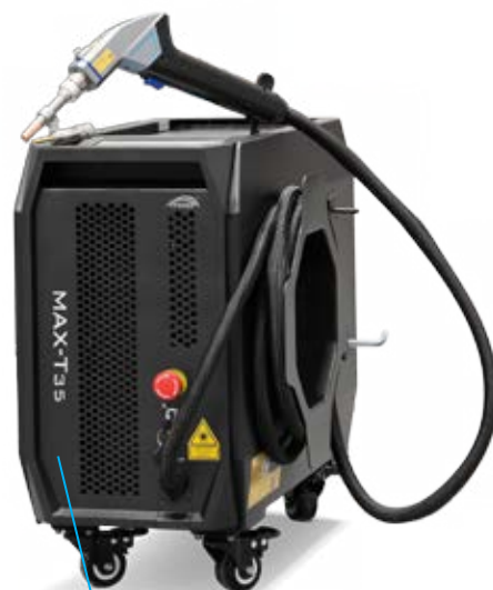
• MOST MAX-T35

Nowa generacja przenośnych spawarek laserowych charakteryzuje się kompaktowymi rozmiarami, małą masą, elastycznością użytkowania i prostotą obsługi. Urządzenia te umożliwiają spawanie stali nierdzewnej, węglowej, aluminium, blachy ocynkowanej, miedzi oraz innych metali.