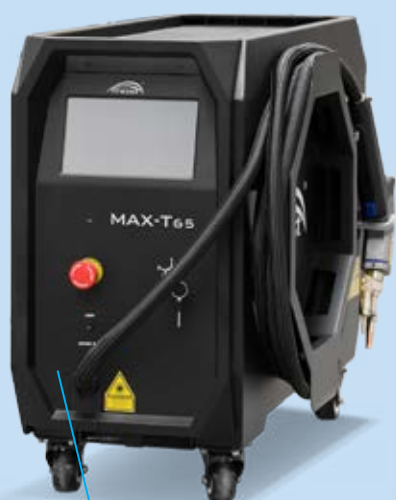
• MOST MAX-T65