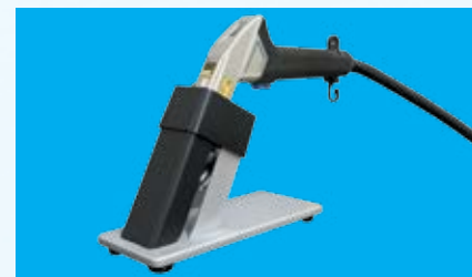
Stojak do głowicy laserowej (opcja) Nr katalogowy: 3L 04 020019